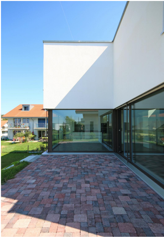
Sicht auf die Terrasse